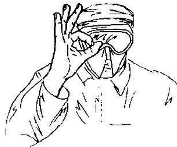
Fig.29- obiettivo -