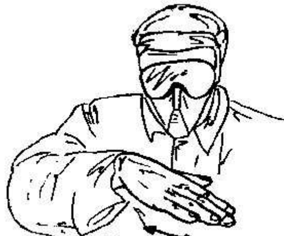
Fig.27- striscidre -