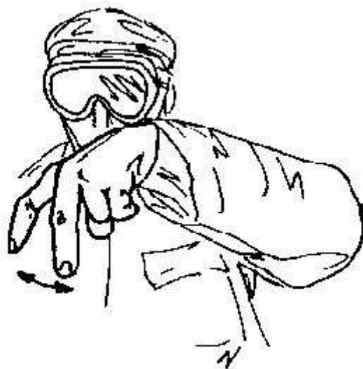
Fig.28- muoversi, avvicinarsi -