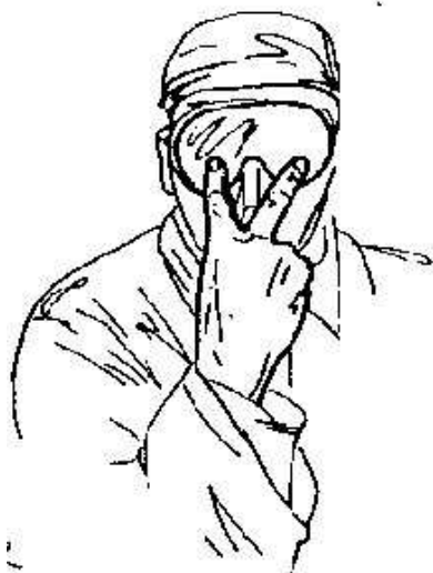
Fig.24- guardare -