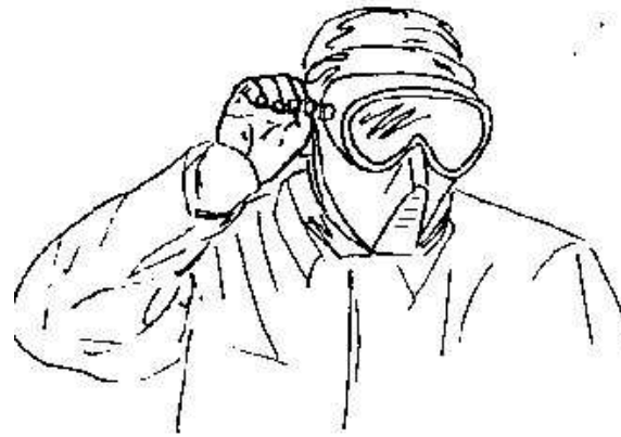
Fig.34- ascoltare -