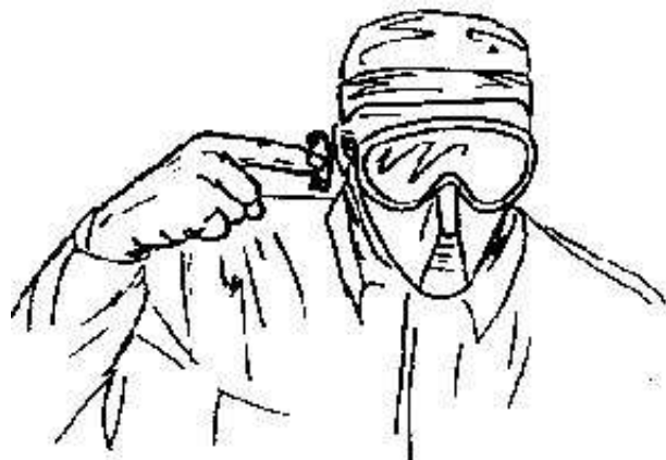
Fig.26- ripetere -