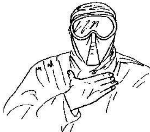
Fig.30- imboscata improvvisata -