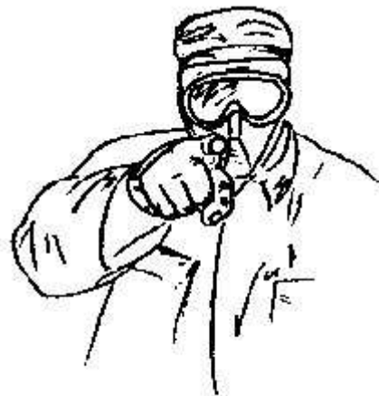
Fig.32- tu -