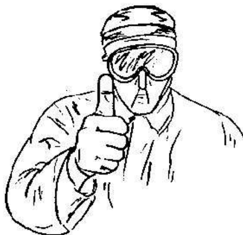
Fig.25- O.K, ricevuto-