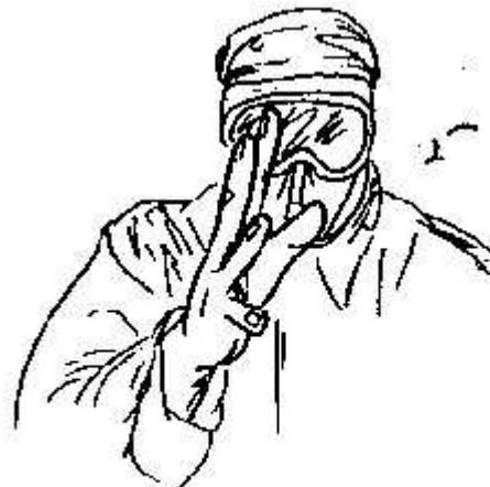
Fig.37- disporsi in fila indiana-