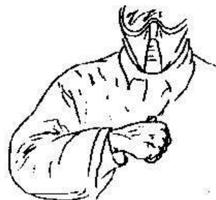
Fig.31- io -