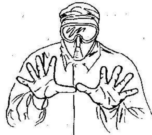
Fig.38- disporsi in linea di fronte-