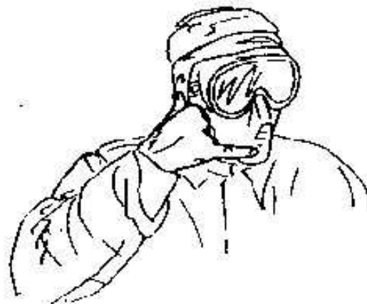
Fig.36- passaparola -