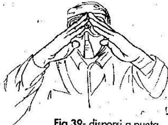
Fig.39- disporsi a punta di freccia -