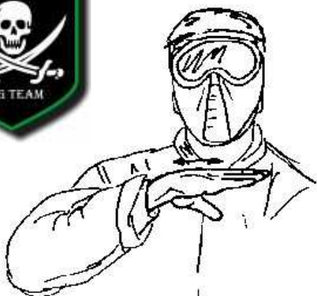
Fig.33- eliminazione avversario -